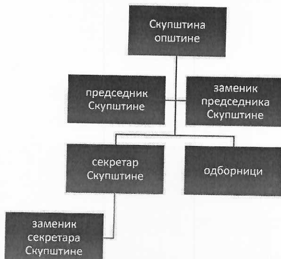
Дијаграм 1: Организациона структура Скупштине општине Нови Кнежевац

Чланом 44. Статута општине Нови Кнежевац („Службени лист општине Нови Кнежевац“, број 03/19) је уређено да Скупштина општине оснива стална и повремена радна тела за разматрање питања из њене надлежности.